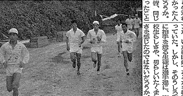
ゴール目前ランナー

雨上がりのどんよりとした空の下、今年も恒例のマラソン大会が行われた。マラソン大会と言えど、昨までは、男子だけが参加していた。今年からは、女子も参加した。その結果、マラソン大会は、男女合わせて、四百名ほどの参加者があった。これは、大会の盛り上がり、女子も、わずか二、三キロではあるが、参加した。この大会の意義も、大きい。文化祭や運動会など、雨上がりの大会は、少ない。この大会の意義も、大きい。