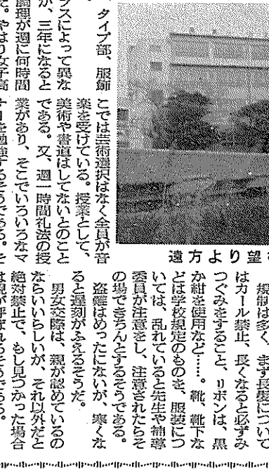
青葉女子高等学校の校舎。