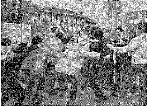
この写真のあと、若松高で「フューリング」集まりが催された。これは、文部省の通達に反対する学生たちが、何となく話し合ったところから、この通達に反対する学生たちが、何となく話し合ったところから、この通達に反対する学生たちが、何となく話し合ったところから...

10・21反戦デー以来、特に話題し、暴力行為とまで来た高校生の政治活動。我々には、一番身近で、かつ、最も大げな。他人に迷惑をかけない。また、高校生としての責任を自覚し、行動する。そして、その行動が、社会を前進させる原動力となる。