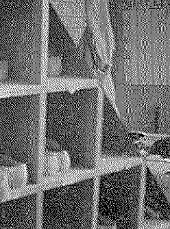
盗難の減少は、自分なりに守るようになっている。

盗難の減少は、自分なりに守るようになっている。服装問題も、自分なりに守るようになっている。遅刻も減少している。これは、自分なりに守るようになっているからである。