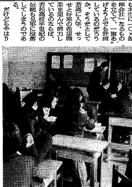
の だ け だ 選 考 委 員 に 対 し て 極 力 努 力 以 て 寄 与 せ て 行 々 進 歩 中 な ら ば 若 松 高 校 半 世 紀 の 傳 承 的 な 努 力 に 対 し て 寄 与 せ て 行 々 進 歩 中 な ら ば

も本間に「〇」混 博 會 社 なるもの を 立 て て 一 旗 奮 け る だ ろ う か ぞ だ だ だ 若 高 生 入 学 せ せ っ と 研 究 費 用 業 者 的 な 努 力 以 て 行 々 進 歩 中 な ら ば 若 松 高 校 半 世 紀 の 傳 承 的 な 努 力 に 対 し て 寄 与 せ て 行 々 進 歩 中 な ら ば