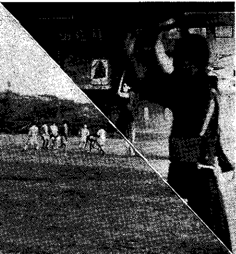
勝負は気力で (ラグビー部) (剣道部)