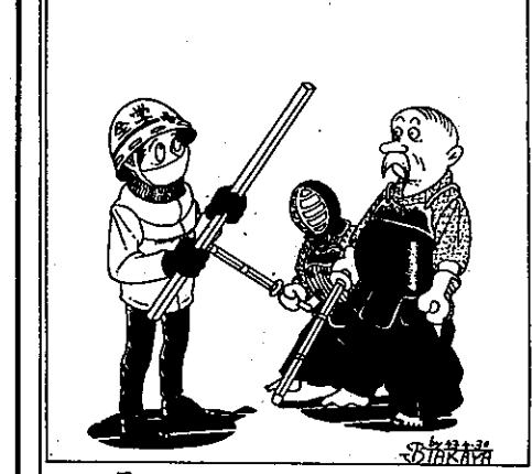
先生「君、何か感ぢかい」 居らんぢないかい

「高専は義務教育ではない」と。これは若君の心に響いた。若君はこれに気がついてきた。絶対的な目的意識を持って入学したかと思ふ。いやこれは若君が持っているものだ。