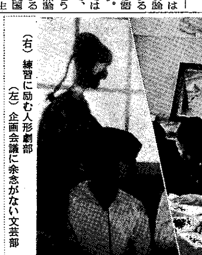
練習に励む人形劇部