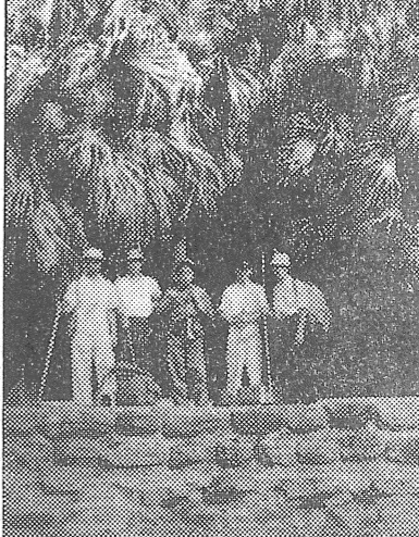
生物部員が採集活動中。自然の中で生き物の観察や採集を行いました。

本校の生物部員は、自然と親しむため、採集活動を行いました。採集は、八十余名の大世帯で行われ、部員たちは自然の中で生き物の観察や採集を行いました。採集した生き物は、生物部で観察や飼育が行われます。採集活動を通じて、部員たちは自然の素晴らしさを実感し、生き物への関心を高めることができました。