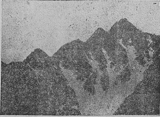
梅や深山山金鳳花、黄白、駒草等の白、黄あるいは紫色の高山植物の花畑が珍奇なる山岳の間を奇麗に彩つていたり、目に入るものは皆珍らしいものばかりだつた。(北塔より前掲高を写す)

焚書焼くという言葉がある。辞たこと、こいつは焚書である。古来書を引くと、秦の始皇帝が四書五から書な権力による文化镇压の